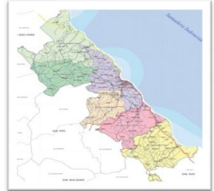
Gambar 1. Peta Kota Gunungsitoli