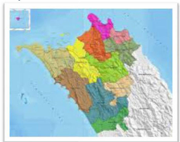
Gambar 3. Peta Kabupaten Nias Barat