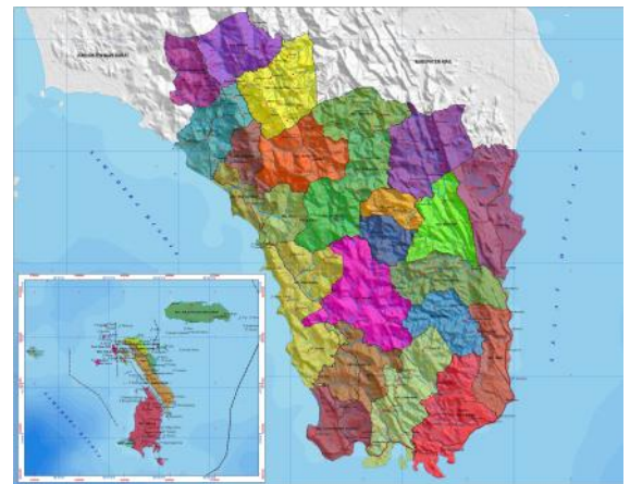
Gambar 5. Peta Kabupaten Nias Selatan