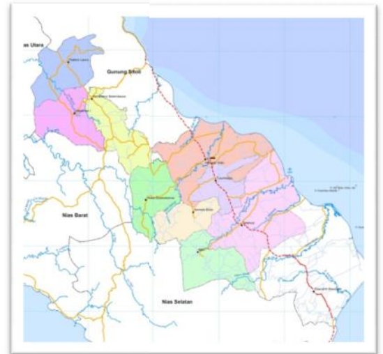
Gambar 2. Peta Kabupaten Nias